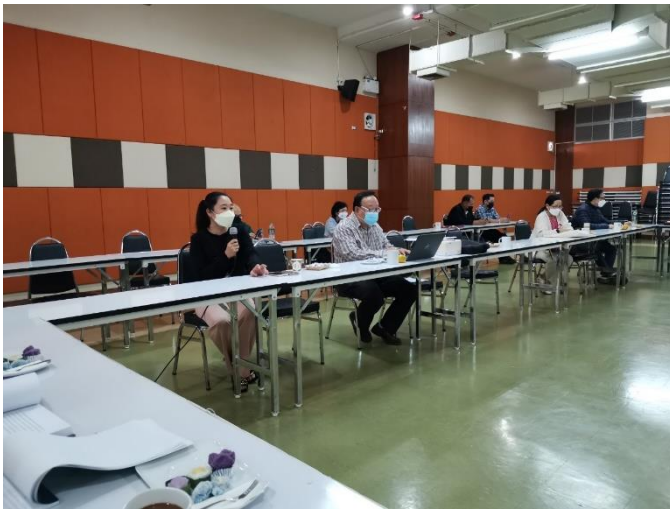
บุคลากรร่วมแลกเปลี่ยนความคิดเห็นการบริหารจัดการวิทยาลัยบริหารศาสตร์