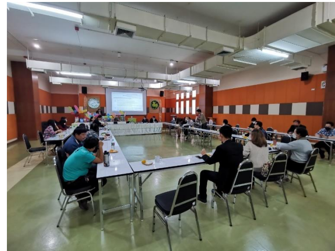
บุคลากรรับฟังนโยบายการบริหารจัดการวิทยาลัยบริหารศาสตร์