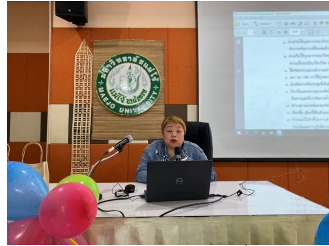
ผู้อำนวยการสำนักงานคณบดีวิทยาลัยบริหารศาสตร์ ซีเจงนโยบายการจัดการ สำนักงานสีเขียว